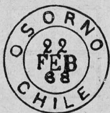
Tipo E. 54