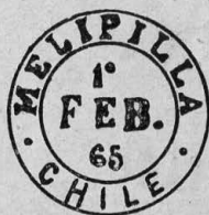
Tipo F. 55