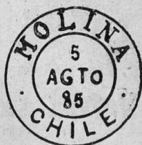
Tipo G. 56