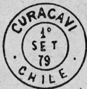
Tipo H. 57